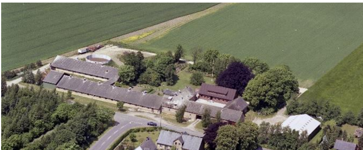
Høvdinggård 1989.

I november 1949 brændte Høvdinggårdens udlænger, da der sprang en gnist fra en brand i Hårlev Nymølle. Det gav efterdønninger, kunne man læse i avisen, Østsjællands Folkeblad: Det kan undre, ikke alene på egnen, men ud over det ganske land, at en stor stationsby som Hårlev er ude af stand til at føde det udkommanderede brandmateriel med vand.